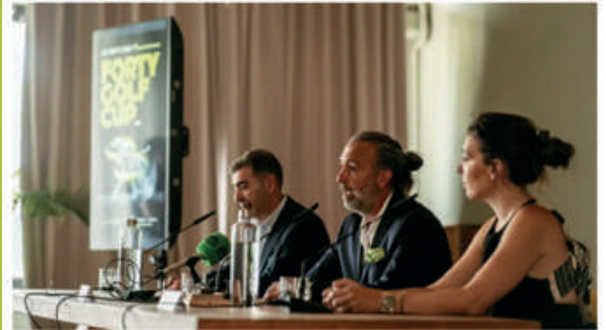
Un instante en la presentación de la Forty Golf Cup.

El torneo, que se desarrollará en formato de competición por equipos y con modalidades fourball (por parejas) , destaca por ofrecer una experiencia única en cada hoyo. Además, cada hoyo brindará la posibilidad de obtener un premio , haciendo que cada momento del juego sea emocionante y tenga su recompensa.