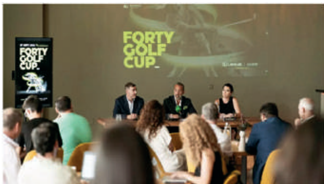
Presentación del evento Forty Golf Cup Alicante en los salones de Petimetr.

La competición, que se disputará el próximo 7 de septiembre, busca unir el deporte, la gastronomía y el ocio en una experiencia con multitud de sorpresas y emociones