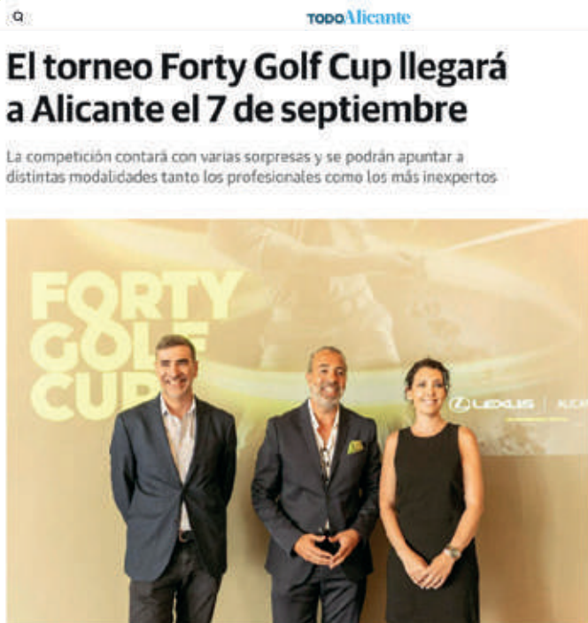
Presentación de la copa. Party

La FORTY GOLF CUP se celebrará el próximo 7 de septiembre en Alicante Golf y ha sido concebida como «una auténtica fiesta del golf». El evento, pensado para todos los quieran disfrutar de este día, ha sido presentado este jueves en Petimetre.